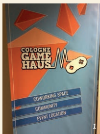
Game Haus (1, 2, 3) tentoonstelling SHINE (4, 5)